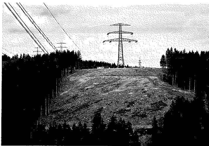
Stromtrasse im Thüringer Wald: Die Natur zahlt mit

RALF BESTE, MAX BIEDERBECK, MANFRED DWORSCHAK, JÖRG SCHINDLER, GERALD TRAUPEFETTER