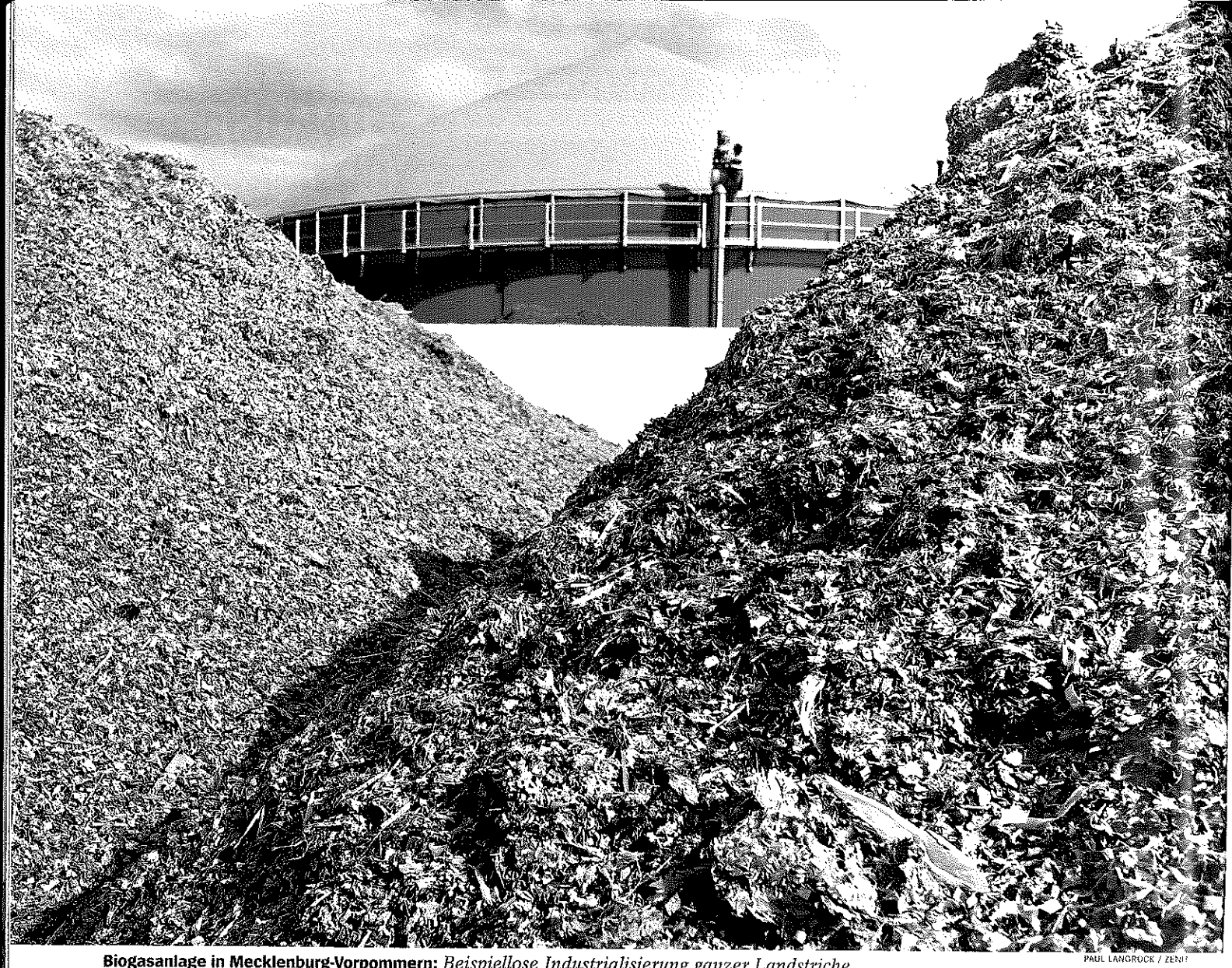
Biogasanlage in Mecklenburg-Vorpommern: Beispiellose Industrialisierung ganzer Landstriche