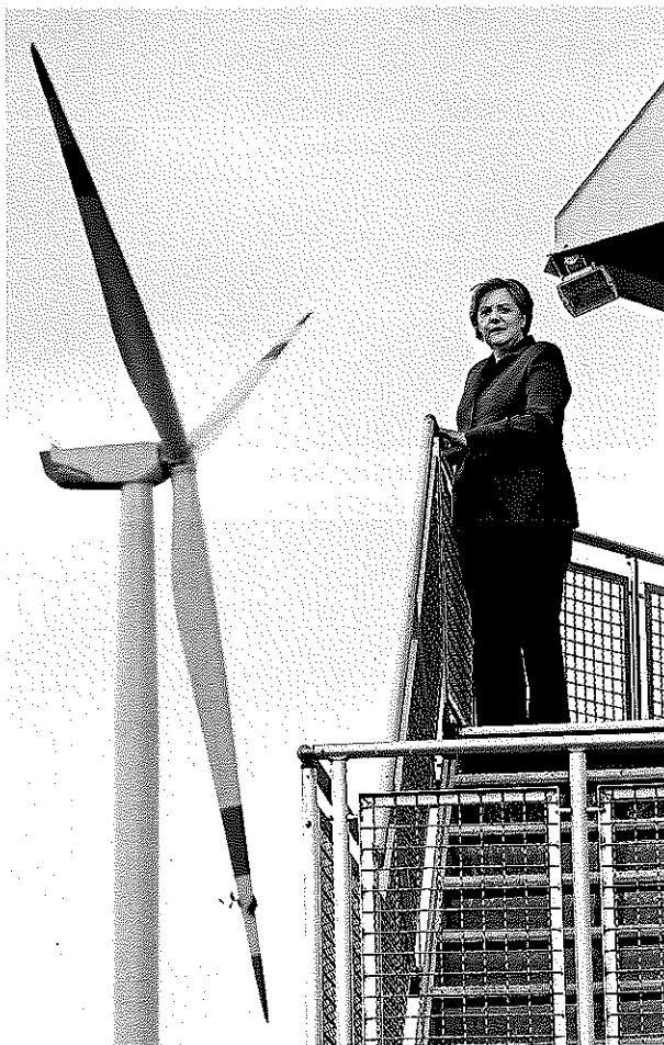
Klimakanzlerin Merkel: Keil in die Ökobilanz